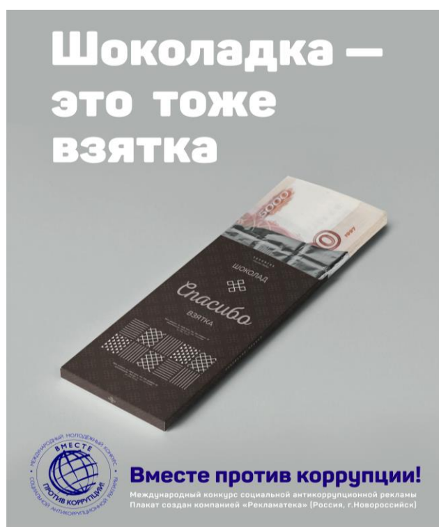
«Шоколадка – это тоже взятка» Автор: Крючков Виктор